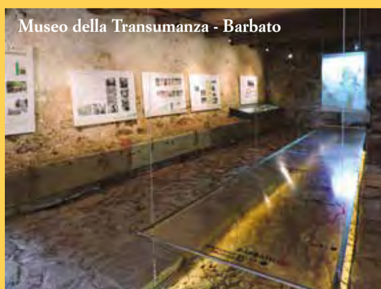
Museo della Transumanza - Barbato

Per informazioni e ragguagli consultare la pagina Facebook del DocBi e dell'Oasi Zegna o telefonare ai numeri 015 31463 (DocBi) e 340 1989593 (Oasi Zegna).