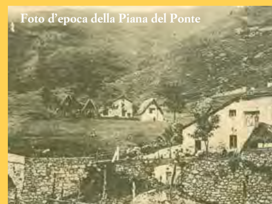
Foto d'epoca della Piana del Ponte